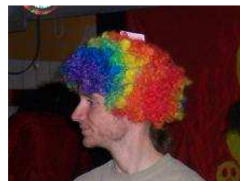
M.B.o.B. Tieftonbediener Rotes Zeuch Trinker Haarproblem Stufe 3