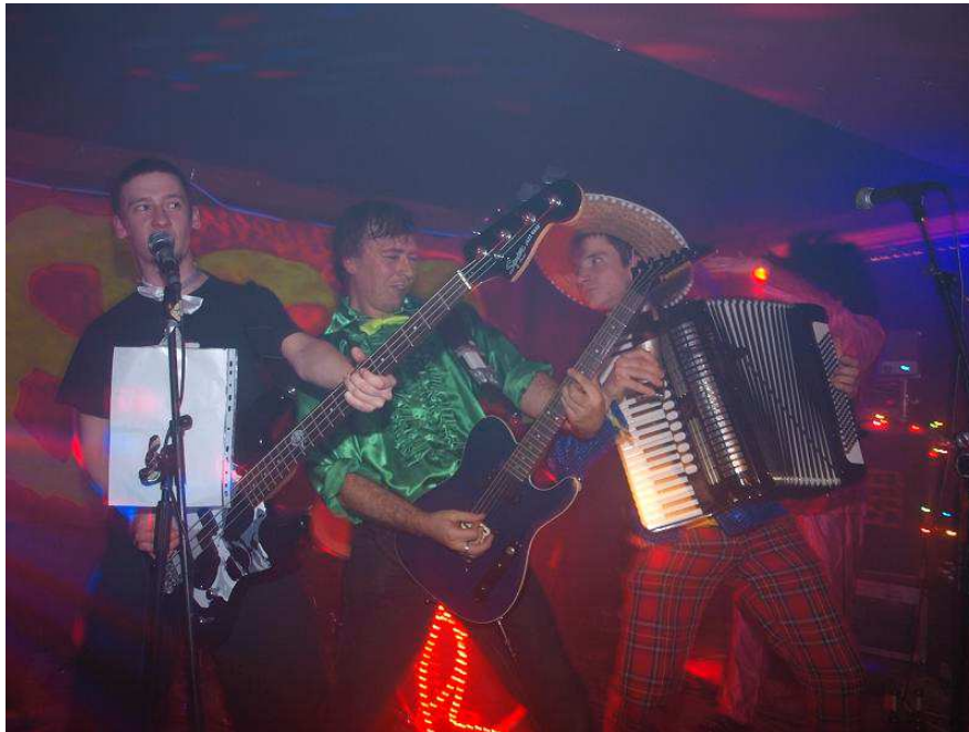
(B.o.B. ohne Mutti)