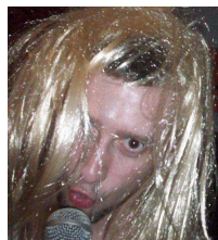
Cargo B.o.B. Oben Luft Tester Saitenreiter Allesvernichter Ohne Haar Problem!!!