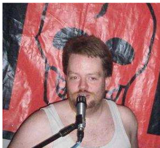
Curly B.o.B. Tastendrucker Bandintellektueller Pfefferminzliebhaber Haarproblem Stufe 4