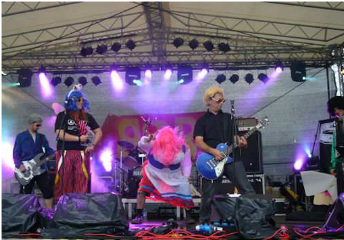
(B.o.B. und Mutti mit den pinken Haaren)

Ganz Europa sucht den Superstar. Ganz Europa? Nein ein kleines Grüppchen von unerschrockenen Lärmisten denkt nicht mal daran zu einem der zahlreichen Vorsingewettbewerbe zu gehen. Da fahren wir lieber durchs Land und feiern mit allen, die Lust haben, das Gleiche zu tun. Die Welt war uns zu grau und so beschlossen wir, da mal nen bisserl Farbe reinzubringen. Wie nicht schwer zu erraten ist, sind wir ne kleene feine Fun-Punkrock Band. Geben tut es uns seit 2006 und wir kommen aus Bärnin. Standardmäßig haben wir zwei Gitarren, nen Bass, so was wie nen Schlagzeuger und meist nen Akkordeon. Ergänzt werden wir durch Kumpels und Kumpelinen, die Lust und Zeit haben, uns zu begleiten. Aber auch MUTTI wurde schon häufiger gesehen.