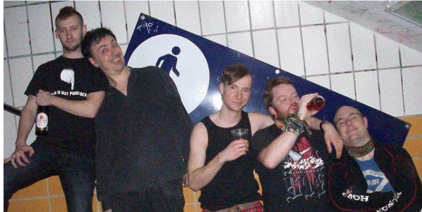
Dillon B.o.B. Kreischer und Saitendrescher Zauberer und Feuerkünstler Teetrinker Haarproblem Stufe 3