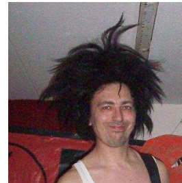
Horst B.o.B. Rückraumschreier und Trommelvermöbler Biervernichter Toupetträger